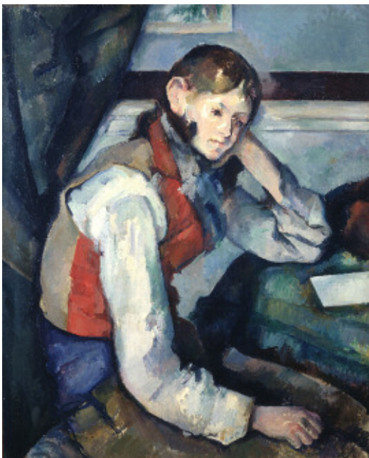
ポール・セザンヌ《赤いチョッキの少年》 1888-90年 油彩、カンヴァス 79.5×64cm

世界でも有数のプライベート・コレクションとして知られているスイス、チューリヒのビュールレ・コレクションから印象派・ポスト印象派を中心に、 アンゲル、ドラクロワ、ドガ、マネ、モネ、ルノワール、セザンヌ、ファン・ゴッホ、ゴーギャン、ピカソ など著名な作家の傑作64点をご覧ください。約半数が日本初公開です。中でも4メートルを超えるモネの《睡蓮》の大作は、今回初めてスイス以外で展示されます。この至上のコレクションは2020年にチューリヒ美術館の新館に移管されるため、日本でまとめてご覧いただけるのは 今回が最後の機会 になります。