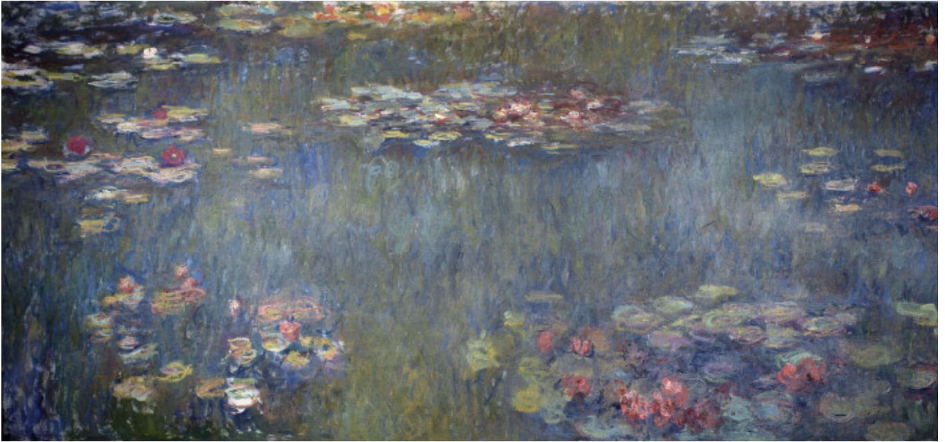
クロード・モネ《睡蓮の池、緑の反映》1920-26年 油彩、カンヴァス 200×425cm