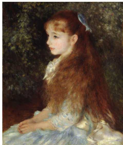
ビュールレ＝オーギュスト・ルノワール 《イレーヌ・カーン・ダンヴェール嬢（可愛いイレーヌ）》 1880年 油彩、カンヴァス 65×54cm