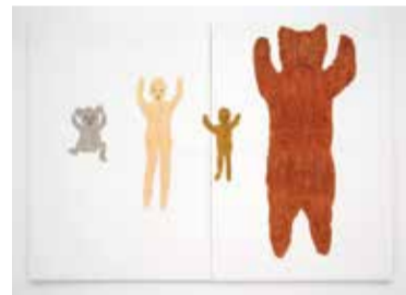
木村充伯《We Mammals》2016年 毛が生えるパネル、油彩 215.6×304.6×5.1 cm

「僕たち哺乳類」という平和な展覧会名の背後には、「同類とは何か」と批判的に問う意図が隠れている気がします。同類意識は、人を安心させるかわりに様々な差異を隠蔽します。体毛を持つ、乳で子を育てるといった共通点はあるものの、人間とその他の哺乳動物は果たしてどこまで似ているのでしょうか。同様に、木村さんの単純そうに見えて不可解な作品は、「〇〇に似ている」と形容された瞬間に、実態から遠ざかります。今回の個展に関しては、木村さんの「類似性についての探求」は、技法においてもさることながら、主題において深まっているように思えました。（nori）