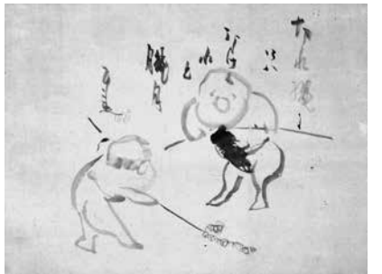
仙厓義梵《臘月》永青文庫蔵

選定の真っ最中です。名古屋ではあまり近世禅画の名品を目にする機会がありませんでしたが、この展覧会によって、その親しみやすさと奥深さを多くの方々にお伝えできればと思っています。(nori)