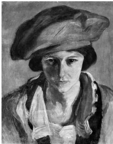
安藤邦衛《赤い帽子をかぶった女》1919年 名古屋市美術館寄託

安藤は苦しい生活のなかでも作品を売ろうとはしなかったという。第二次世界大戦により、研究所と自作、所蔵の他者作品を焼失する。愛知県美術館所蔵の《ラ・セヌ》(1927年)は、唯一のパブリック・コレクション作品である。近年、名古屋市美術館が受託した《赤い帽子をかぶった女》(1919年)は、滞米期の作品として重要であり、人物画として風景画の《ラ・セヌ》を補い、作家の表現の幅や特質を知る手がかりとなる。(み。)