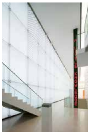
展示風景 *左方ガラス壁面上が出品作品(bugs on glass wall)(2015-16年)

今秋には碧南市藤井達吉現代美術館でも個展（会期：10月15日〔土〕-12月4日〔日〕）が開催されます。「創造の原点から色斑空間へ」と副題されたこちらの展示によっても作家の創作への理解が深められることを期待しています。（み。）